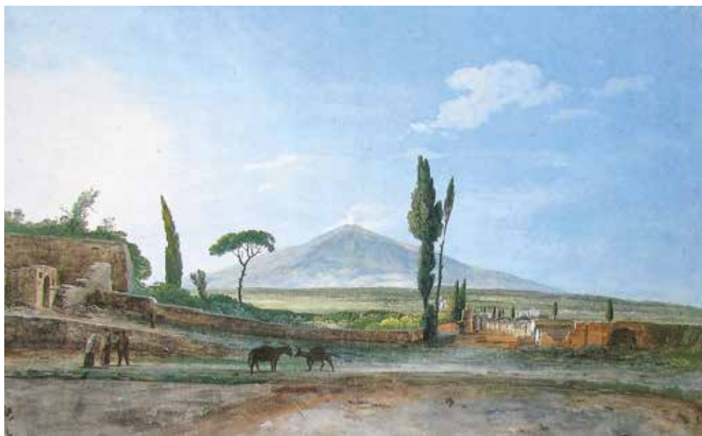
1. San Pietroburgo, Museo dell'Ermitage. Acquerello di Jean Houel.

Già il Biscari era consapevole che, oltre ai grandi monumenti descritti, il cimitero constava di innumerevoli deposizioni di natura più modesta, in fosse scavate nella terra o in muratura, dalle quali provenivano numerose epigrafi funerarie confluite