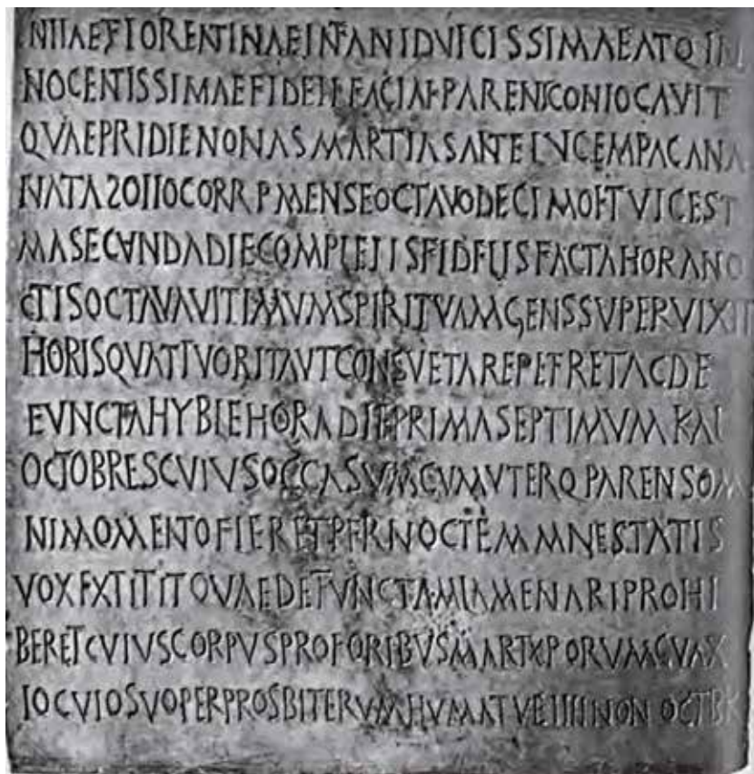
5. L'epigrafe di Iulia Florentina (da V. RIZZONE, Opus Christi edificabit. Stati e funzioni dei cristiani di Sicilia attraverso l'apporto dell'epigrafia (secoli IV-VI) , Catania, 2011, fig. 72)