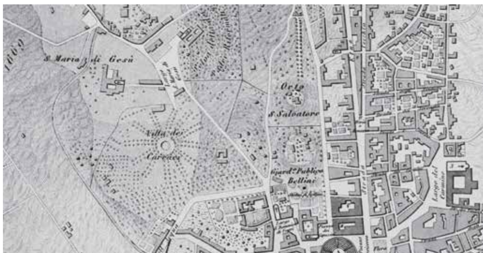
2. Pianta di Catania, Allodi 1840. Particolare.

nella raccolta dello stesso Biscari o dei Padri Benedettini. La più insigne di queste iscrizioni è certamente quella di Iulia Florentina, oggi conservata al Museo del Louvre.