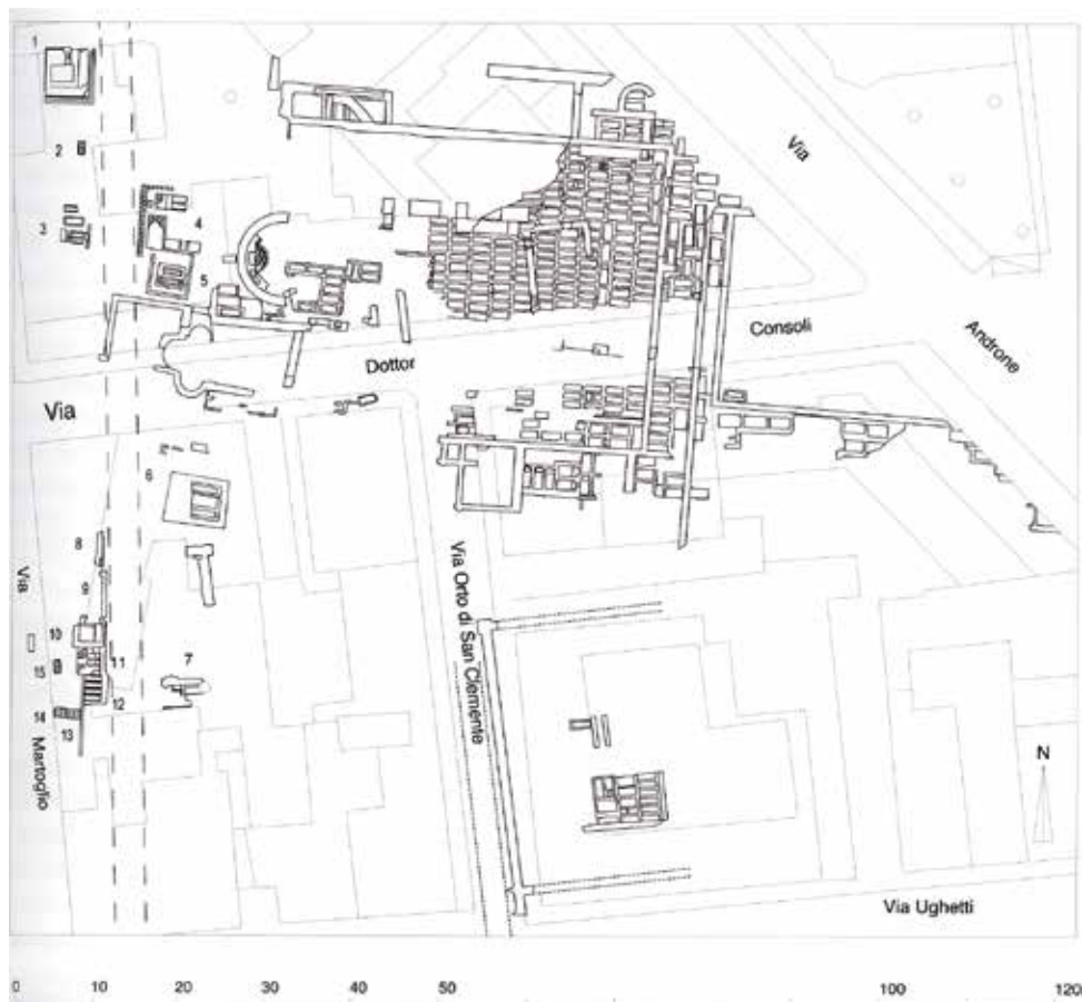
4. Pianta ricostruttiva dei rinvenimenti nell'area della Via Dottor Consoli (da E. TORTORICI, Catania Antica. La Carta Archeologica , fig. 43).

Decisamente, Iulia era una bimba fuori del comune: due eventi straordinari si erano verificati al momento della sua morte e non potevano non essere ricordati dai