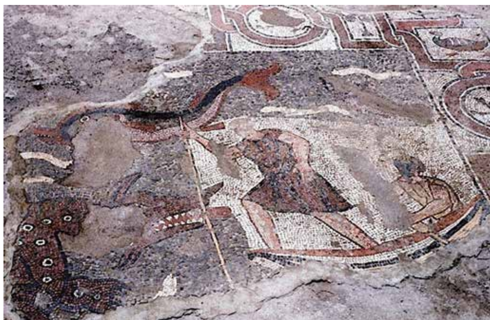
3. Particolare del mosaico della Basilica paleocristiana di Via Dottor Consoli: pescatori e mostro marino.

Possiamo calcolare certamente in migliaia le sepolture distrutte, un'enorme quantità di resti umani dispersi, corredi e