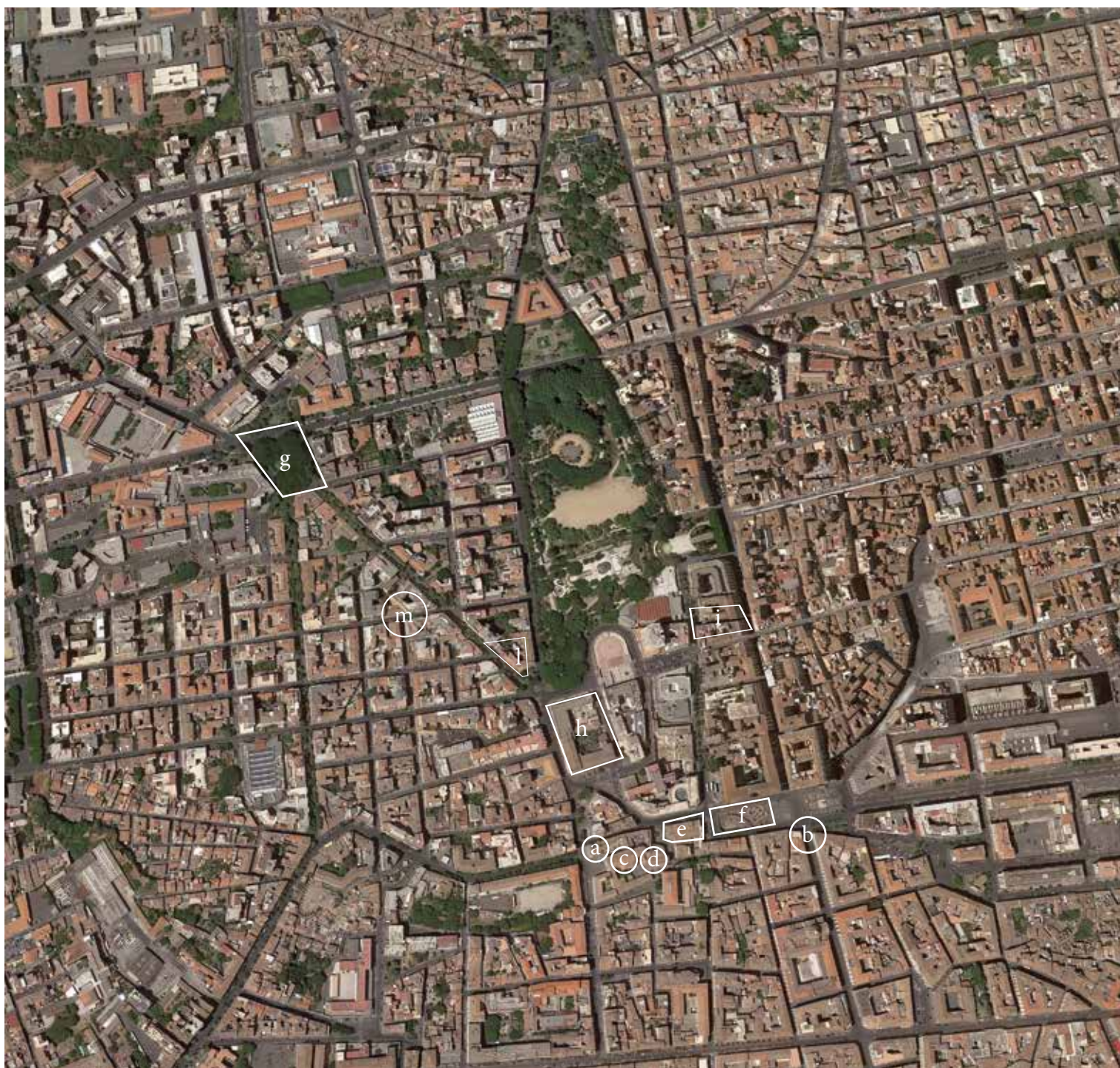
6. Ubicazione del sepolcreto che ospitava la tomba di Iulia Florentina: A . Porta del Re o Porta Regia; B . Porta di Acì (anticamente detta Porta Stesicorea); C . Chiesa di Sant'Agata La Vetere; D . Chiesa di Sant'Agata al Carcere; E . Chiesa di Sant'Agata alla Fornace, altrimenti detta di San Biagio; F . Anfiteatro romano; G . Piazza Santa Maria di Gesù; H . Convento dei Domenicani, con annessa chiesa di Santa Maria La Grande; I . Via Rizzari; L . Luogo di rinvenimento dell'epigrafe di Iulia Florentina; M . Sepolcreto ed edifici di culto di via Dottor Consoli (elaborazione Cristina Soraci ).

La lettura di un manoscritto conservato nella Biblioteca Regionale di Catania ha