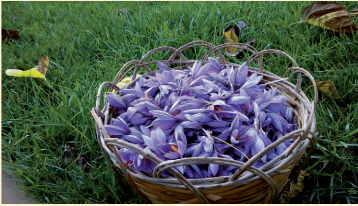
2. Fiori raccolti in ceste di vimini.