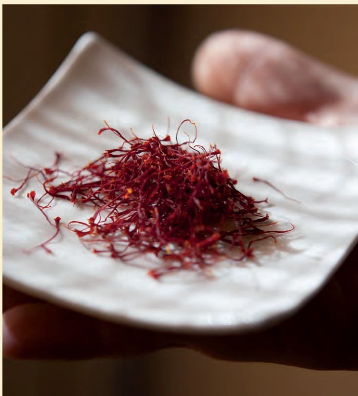
4. Confezionamento dei pistilli.