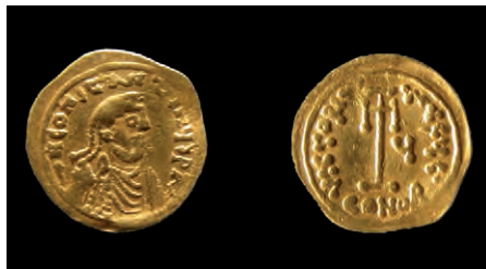
Tremisse aureo di Costante II, 662-668 d.C. Dai recenti scavi alla Rotonda di Catania.

Ma nel tardo '800 la città dimenticò di essere antica ed abbracciò una dimensione