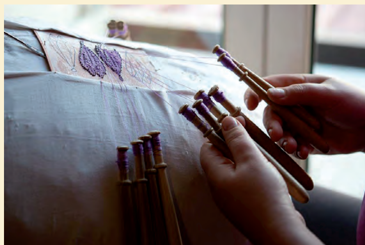
5. Lavorazione a tombolo dei petali.