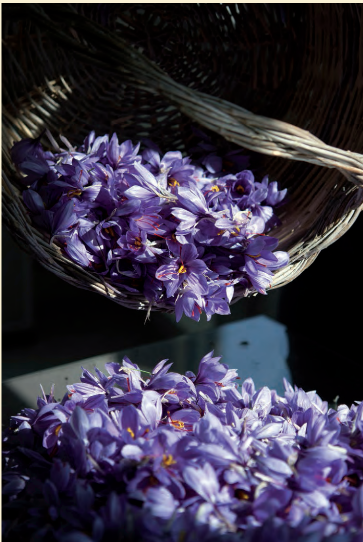
3. In attesa della mondatura.