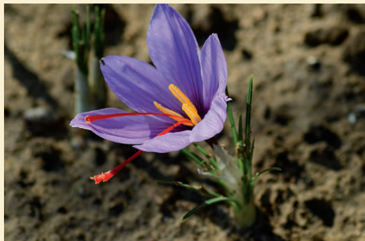
1. Il campo di zafferano a Mirabella Imbaccari (CT).